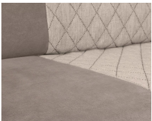
+ Wohnwelt Jupiter