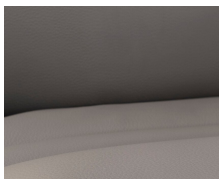
+ Echtleder- Wohnwelt Collin ○