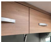
+ Möbeldekor Cape Town