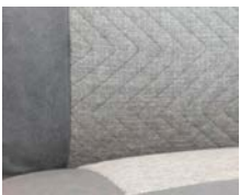
+ Wohnwelt Hygge