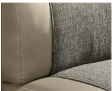
+ Wohnwelt Camino