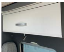
+ Möbeldekor Amberes Oak