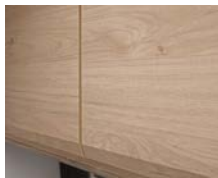
+ Möbeldekor Noce Nagano