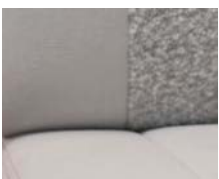
+ Wohnwelt Scandi