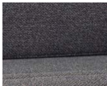
+ Wohnwelt Melia ○