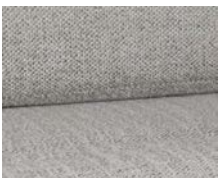
+ Wohnwelt Samir