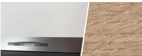
+ Holzdekor Amberes Oak