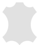
+ Echtleder Individual ○