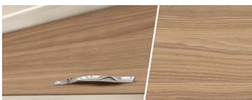
+ Holzdekor Ashton