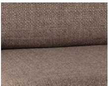
+ Wohnwelt Tarragona ○