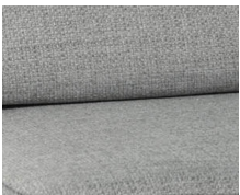
+ Wohnwelt Amposta