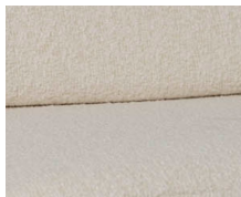
+ Wohnwelt Tropea ○